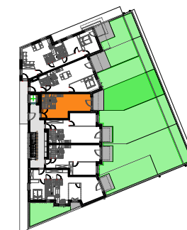
BUDYNEK "A" 1 PIĘTRO